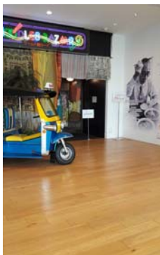
四樓賣午餐的地方, 各國特色麵 (103. 03. 03)