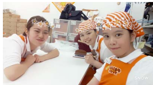
要離開時捨不得的時候跟同事拍的照 片(106. 08. 26)