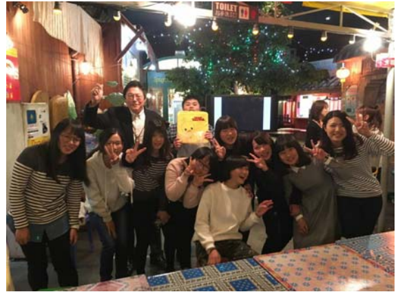
懇親會台灣三月生 10 人合照 (106. 03. 27)