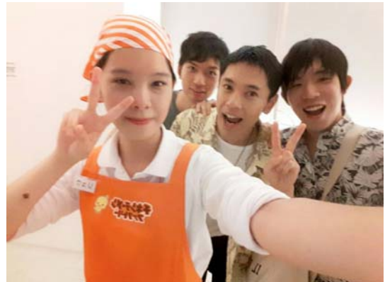
要離開時捨不得的時候跟同事拍的照 片(106. 08. 26)