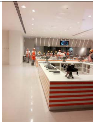
小雞泡麵體驗工房部門2017/06/08