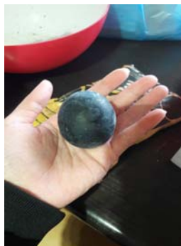
大涌谷名產-黑蛋(106. 04. 27)