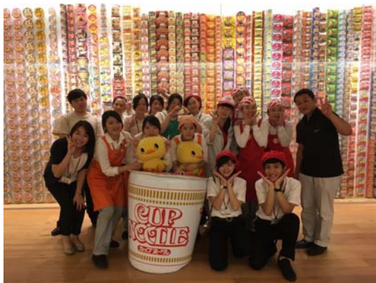
台灣 15 人在泡麵牆合照(106. 08. 27)