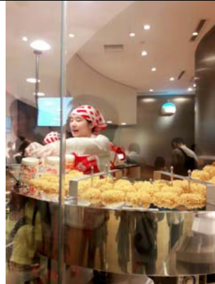
我的杯麵工廠部門2017/06/08