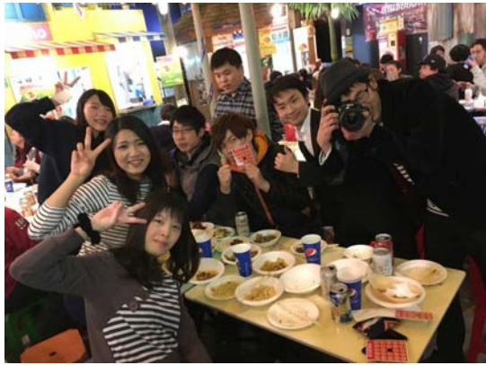
懇親會跟部門的人的合照(106. 03. 27)