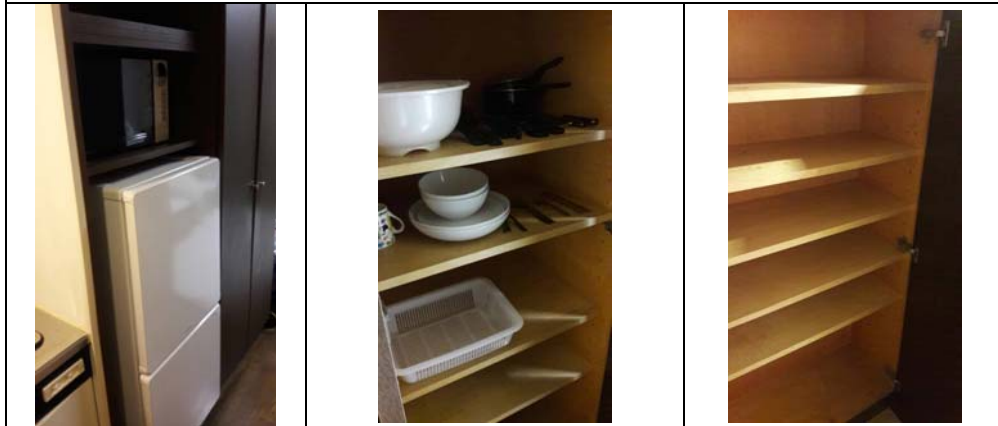
微波爐，冰箱及煮東西的基本配備跟鞋櫃2017/02/28