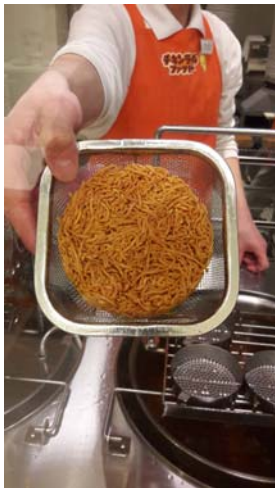
小雞泡麵成品(106. 03. 03)