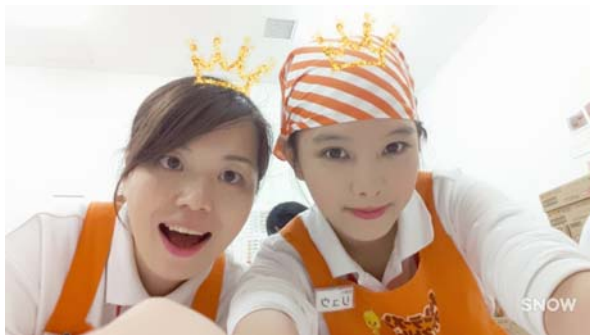
要離開時捨不得的時候跟同事拍的照 (106. 08. 26)