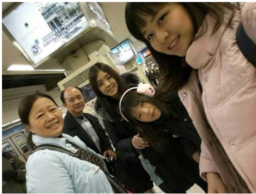
家人來找我玩(106. 03. 26)