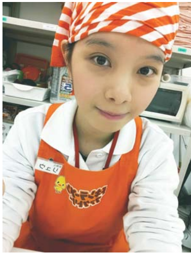
工作開始(106. 03. 06)