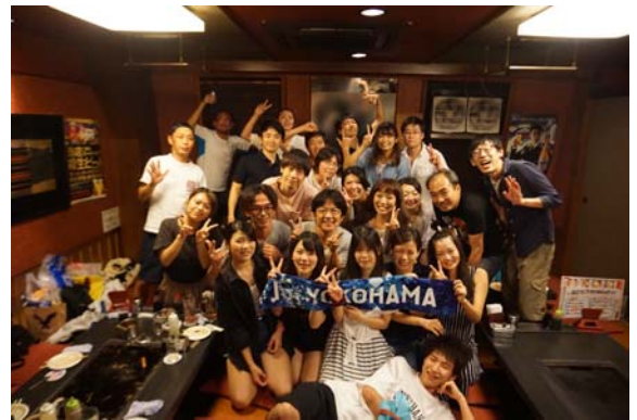
CR 台灣 3 人送別會(106. 08. 27)