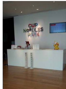
4樓的帶小孩子玩耍的部門(103. 03. 03)