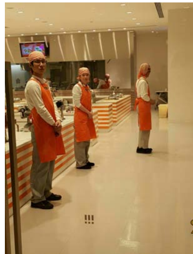
工作時被家人拍下來(106. 03. 27)