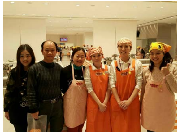
家人來旅遊來我們部門體驗(106. 03. 27)