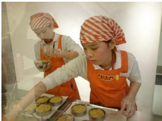
工作時的樣子(106. 03. 27)