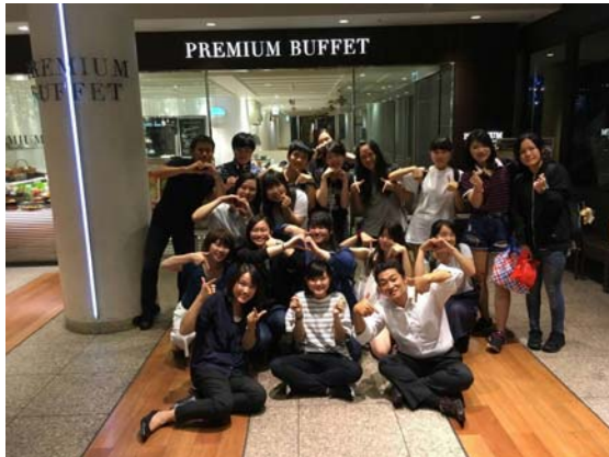
食事會, 工作日倒數2天前跟人力公司的大 家去吃飯(106. 08. 25)