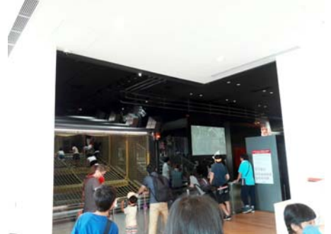
杯麵公園部門，帶小孩玩耍的部門2017/06/08