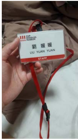
再見了, 陪了我半年的工作證 (106. 08. 26)