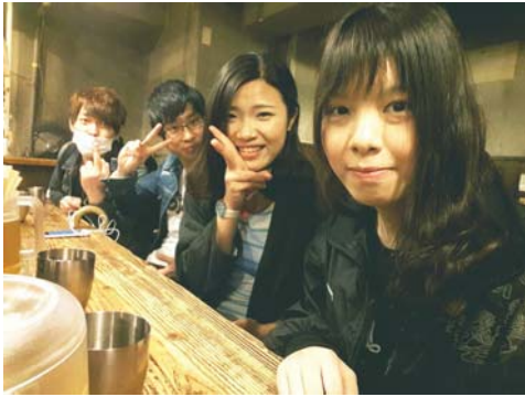
已經辭職的同事推薦我們去吃的超級好吃的拉麵店, 濱虎(106. 05. 25)