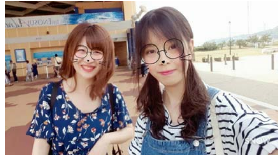
跟同事一起去江之島水族館, 鎌倉 (106.06.20)