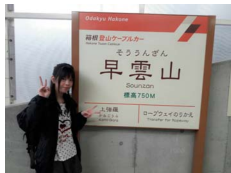
早雲山站(106. 04. 27)