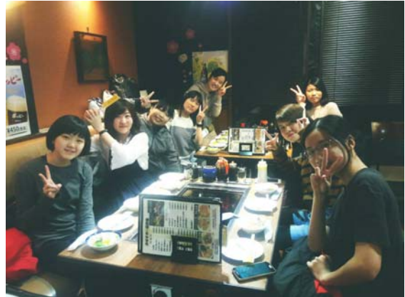
4樓部門的人邀台灣人去吃大阪燒 (106. 04. 24)