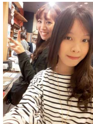
跟自己的老師去淺草晴空塔玩 (106. 06. 06)