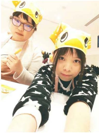
接下來去了小雞泡麵製作體驗工房 (106. 03. 03)