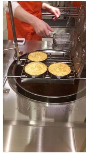
炸麵(106. 03. 03)