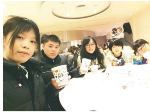
上完課過後兩天的我們接下來去了我們工作地方進行體驗, cop 部門 (106.03.03)