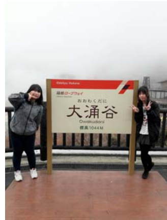
跟室友去箱根玩, 大涌谷(106. 04. 27)