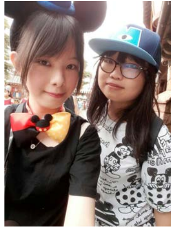
跟室友去迪士尼玩(106. 08. 24)