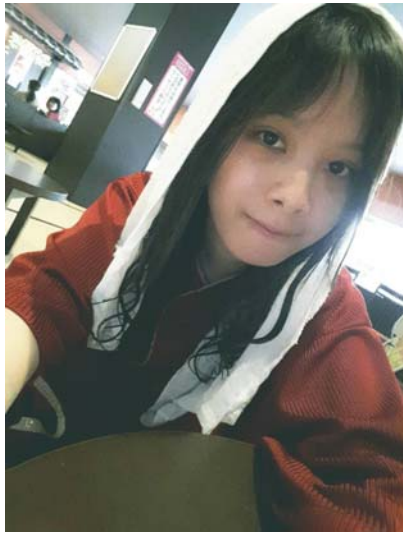
休假時自己去泡溫泉躺岩盤浴 (106. 04. 12)