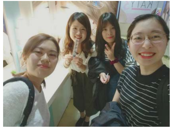
生平第一次跟自己的日本朋友一起去看電影, 因為日本的電影都沒有字幕, 所以其實很難聽懂內容(106. 05. 20)