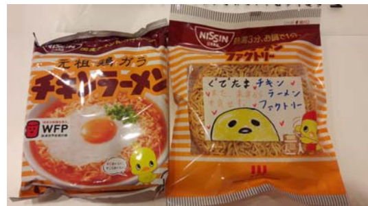
最後拿到的土產(106. 03. 03)