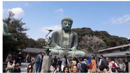
放假跟家人去看鎌倉大佛(106. 03. 28)