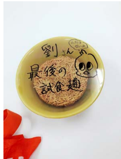
部門的人特地在我的試吃麵上的保鮮膜 寫了最後的試吃麵(106. 08. 27)