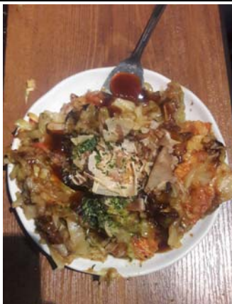
第一次自己做文字燒, 我以為文字燒是 硬吃起來比較有口感, 把文字燒跟大阪 燒搞混的我做出來的成品文字燒 (106. 04. 24)