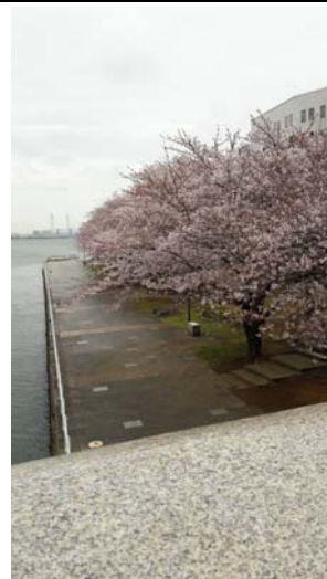
公司附近滿開的櫻花樹(106. 04. 07)