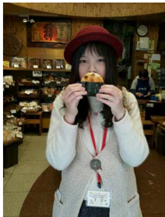
鎌倉吃仙貝(106. 03. 28)