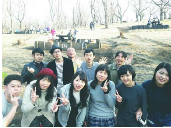
BBQ 烤肉會賞櫻(106. 05. 23)