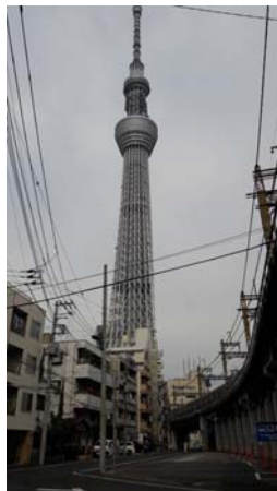
第一次看到晴空塔(106. 06. 06)