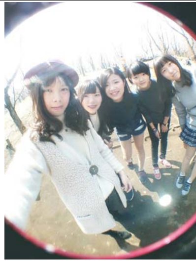
BBQ 烤肉賞櫻會合照(106. 05. 23)