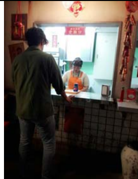
麵之路部門，賣午餐2017/06/08