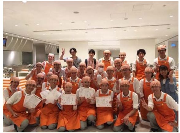
CR 工作最後一天的團體照(106. 08. 27)