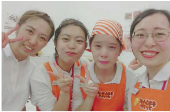
在我哭得很慘的時候趁機跟我拍照的同事(106. 08. 27)