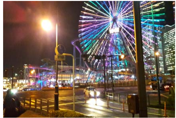
剛開始來工作時晚上的摩天輪, 很冷 (106. 03. 06)